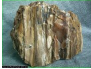
Obrázok 3 – obecný opál