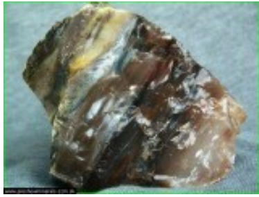
Obrázok 2 – opál voskový