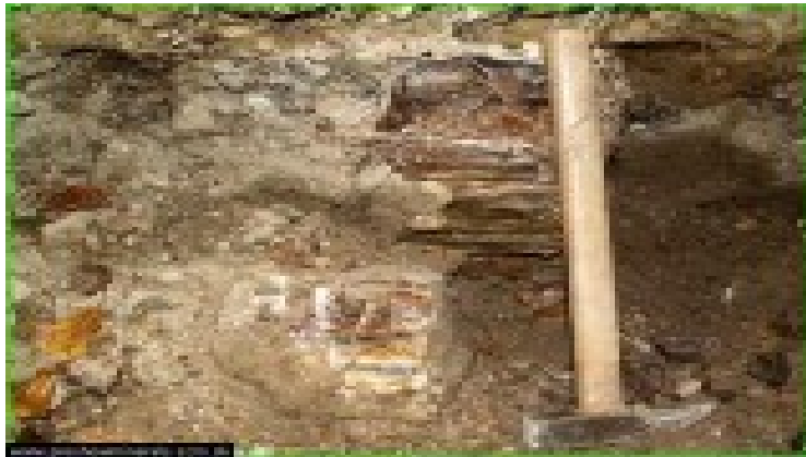
Obrázok 5 – Opálová poloha, Vyšná Kamenica