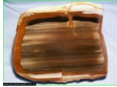
Obrázok 4 - Limnokvarcit