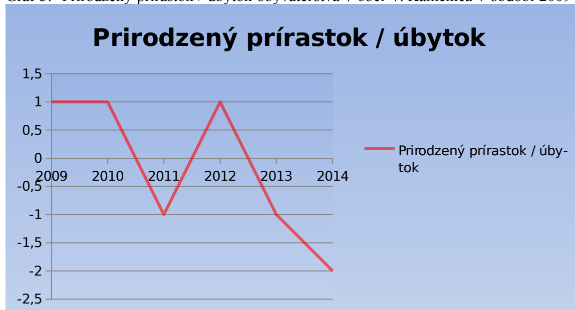
Graf 3: Prirodzený prírastok / úbytok obyvateľstva v obci V. Kamenica v období 2009-2014