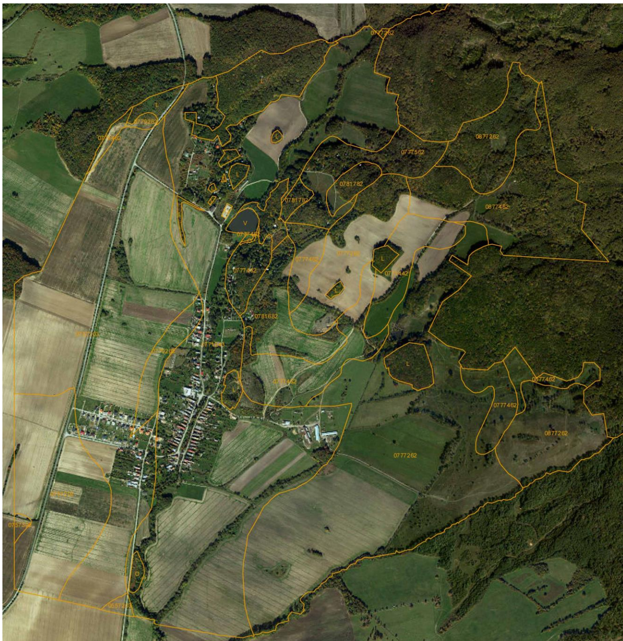
Hranice a kódy BPEJ